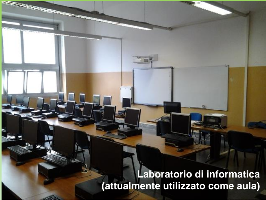
Laboratorio di informatica (attualmente utilizzato come aula)