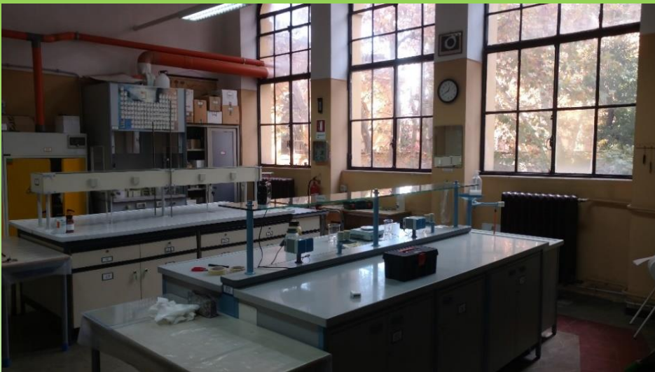
Laboratorio di Chimica