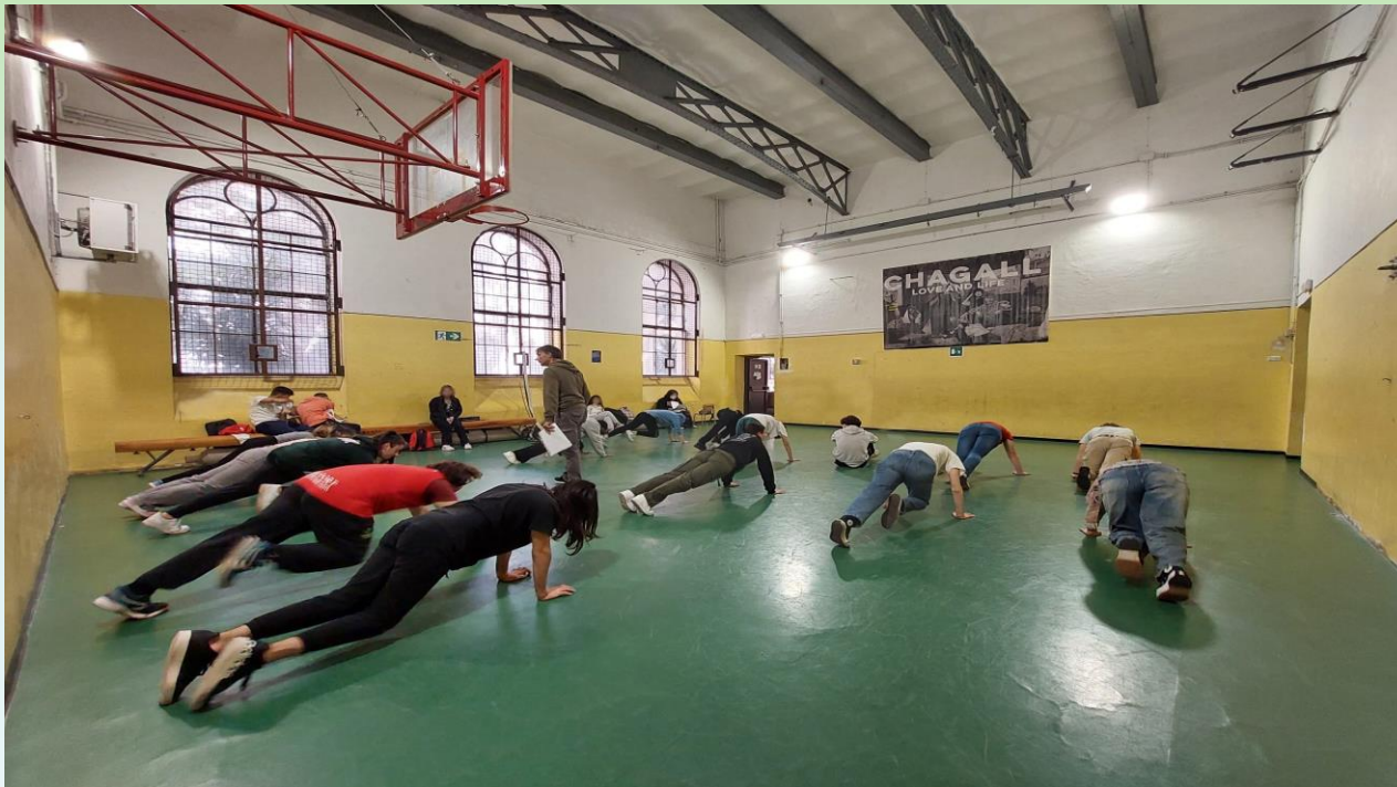
Palestra sede centrale