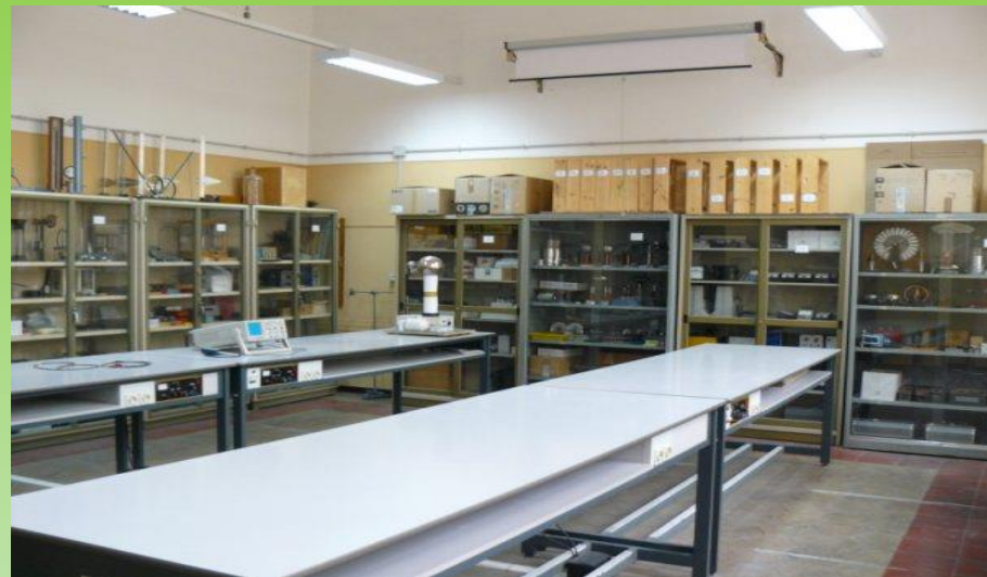
Laboratorio di Fisica