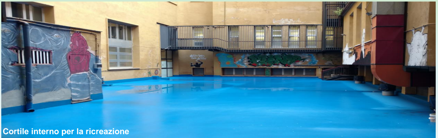
Cortile interno per la ricreazione