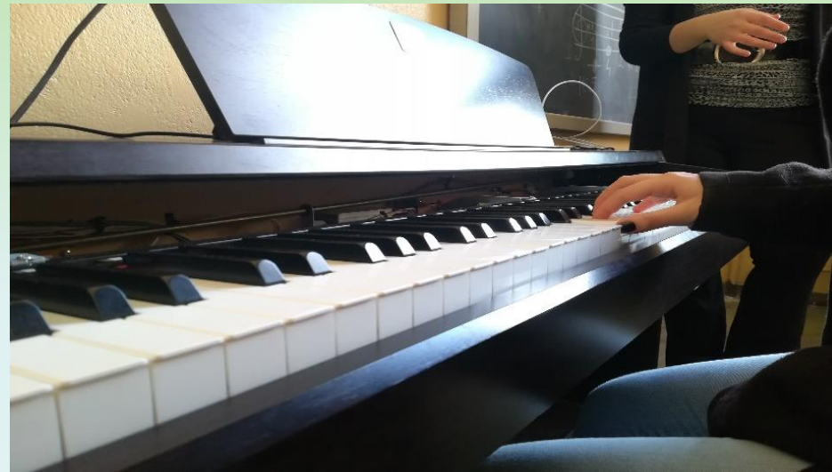
Aula di musica e beni culturali