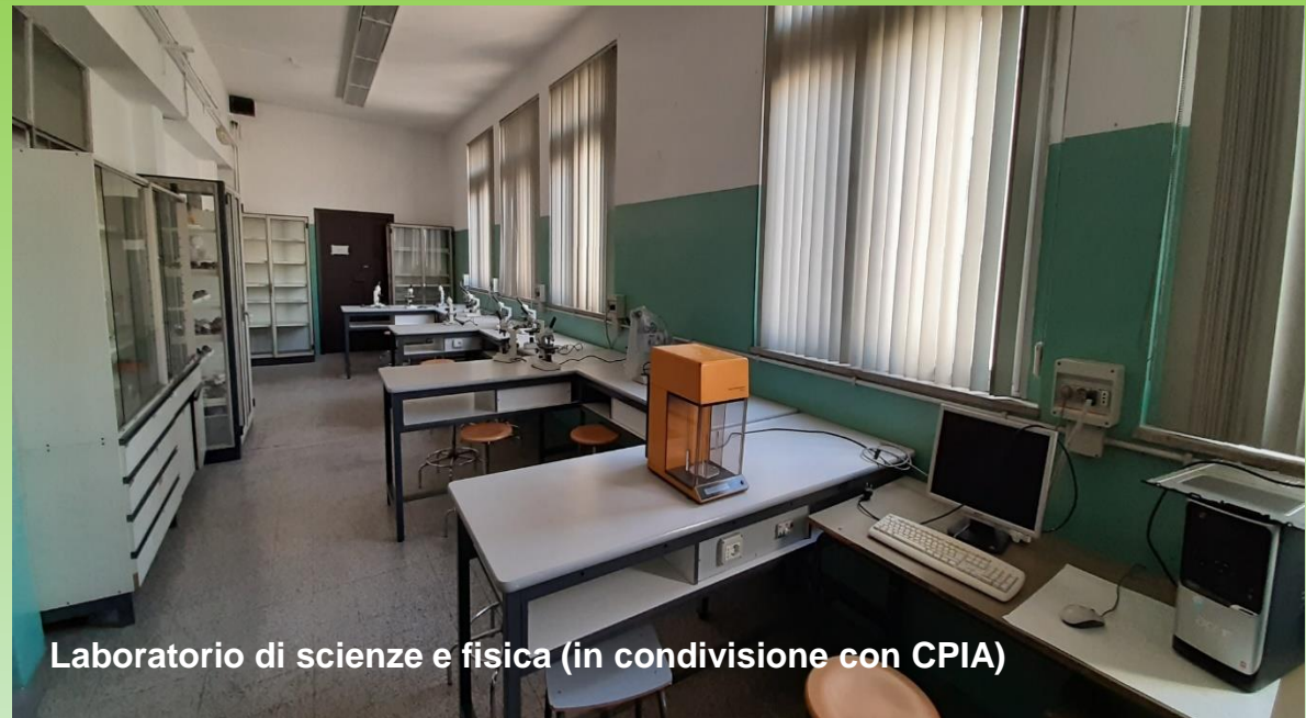
Laboratorio di scienze e fisica (in condivisione con CPIA)