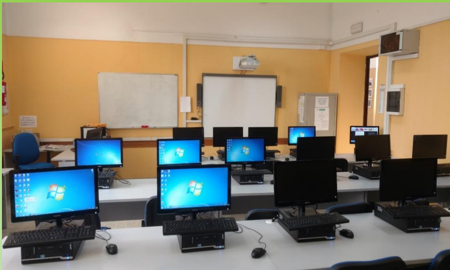
Laboratorio di informatica